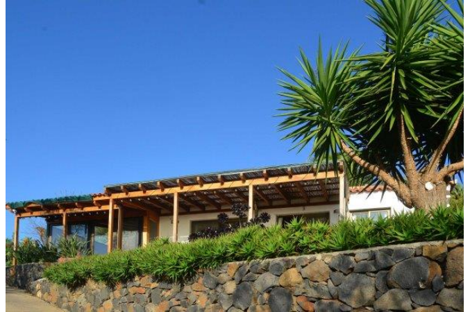
Ansicht von Südwesten