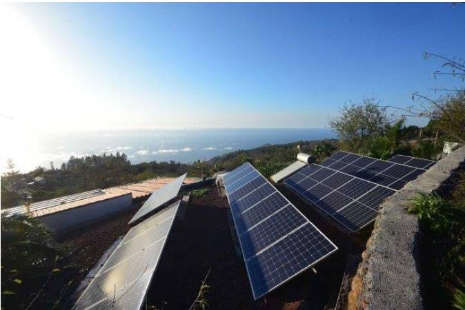
Großzügig dimensionierte Photovoltaikanlage