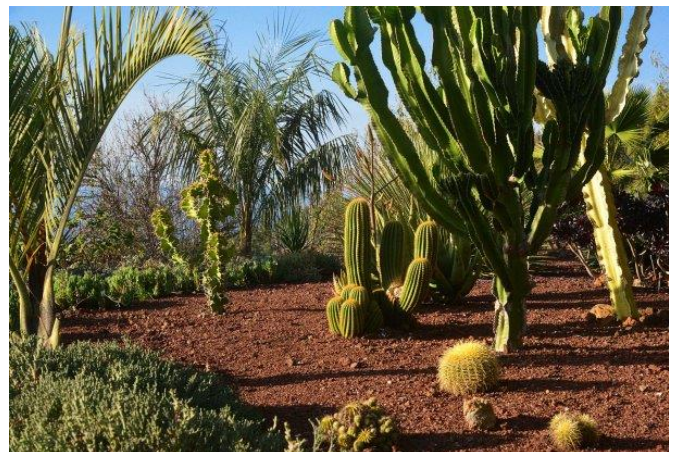
Sehr schön angelegter Ziergarten