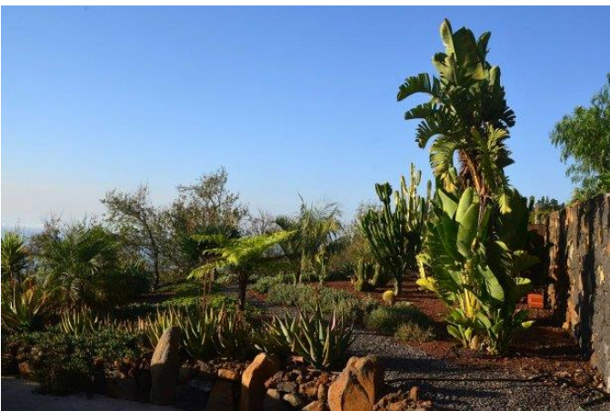
Sehr schön angelegter Ziergarten