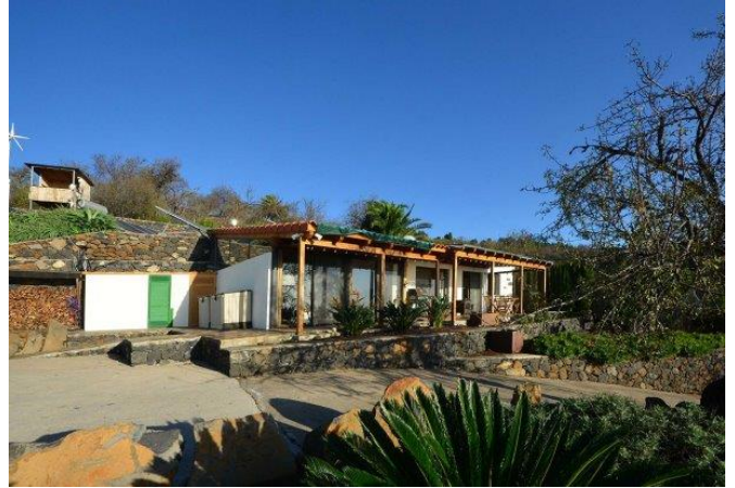
Haupthaus, Technikhäuschen, Hochsitz, PV- und Windkraftanlage