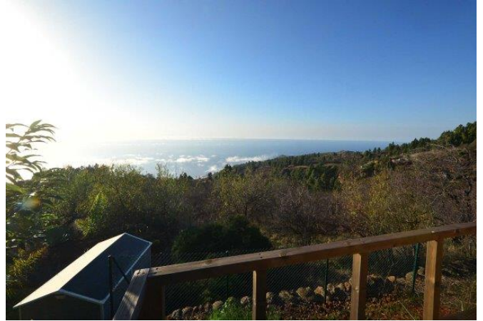
Separates Holzhaus zur multifunktionalen Nutzung