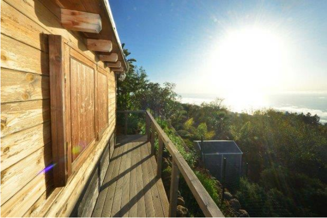
Separates Holzhaus zur multifunktionalen Nutzung