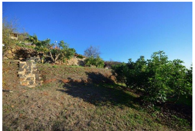
Noch ein wenig Platz für eigene Pflanzenträume