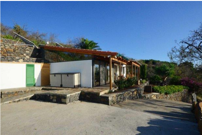
Haupthaus, Technikhäuschen, PV-Anlage