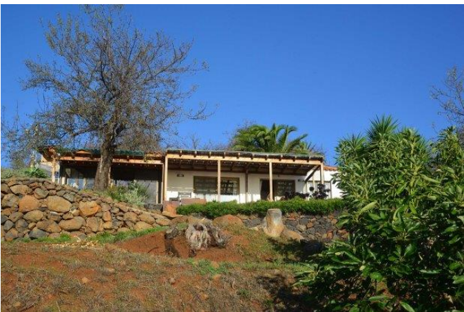
Ansicht von Südwesten