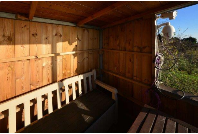
... für unvergessliche Sonnenuntergänge