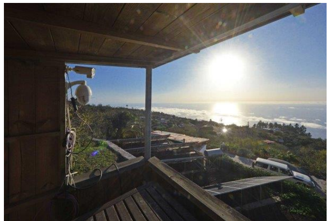
... für unvergessliche Sonnenuntergänge