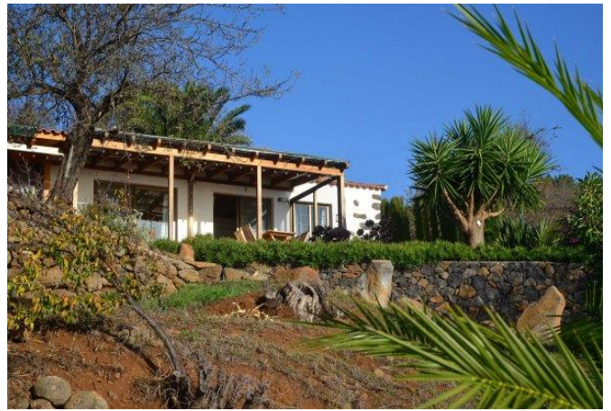
Ansicht von Südwesten