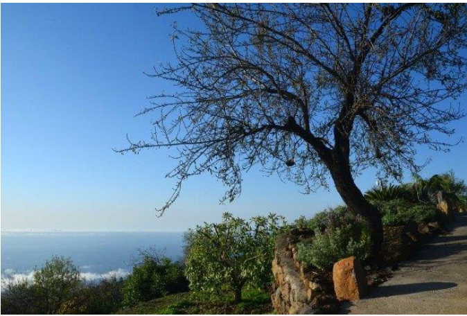
Alter Mandel- und Avokadobestand