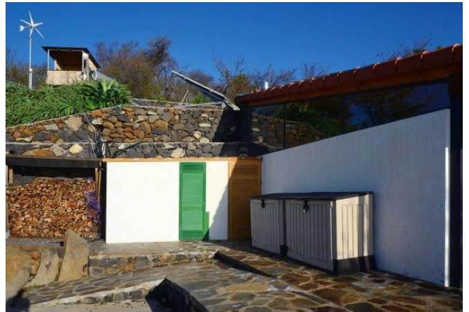
Technikhäuschen, Hochsitz, PV- und Windkraftanlage