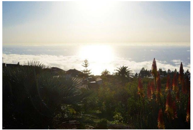
Ganzjährig unvergessliche Sonnenuntergänge