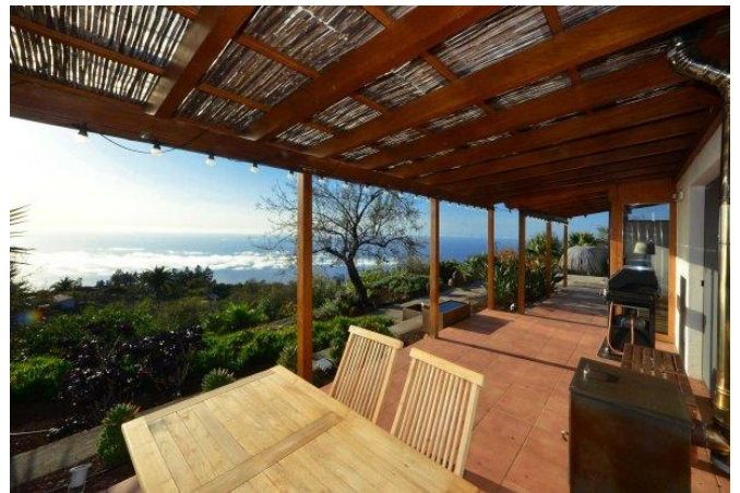
Überdachte Terrasse, fantastischer Atlantikblick