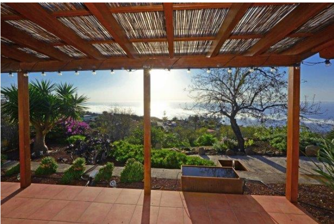
Überdachte Terrasse, fantastischer Atlantikblick