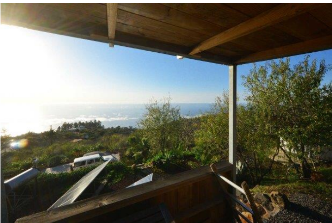
... für unvergessliche Sonnenuntergänge