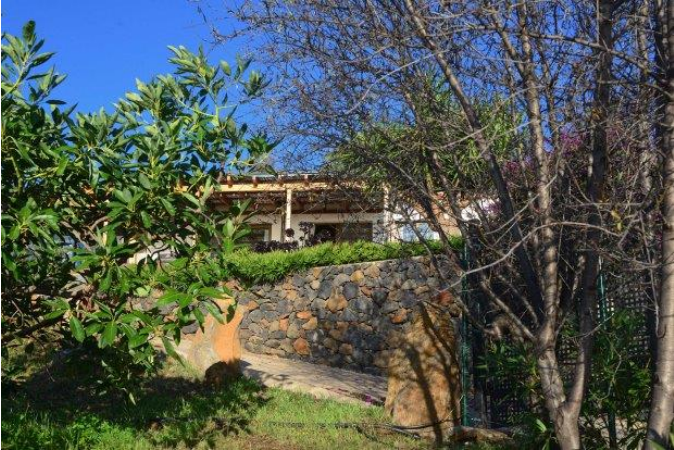
Ansicht von Südwesten