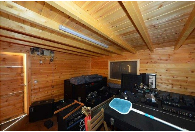
Separates Holzhaus zur multifunktionalen Nutzung