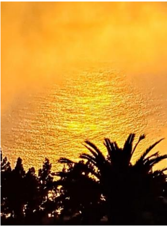
Ganzjährig unvergessliche Sonnenuntergänge